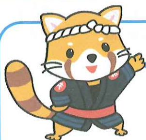
イメージキャラクター 共助くん